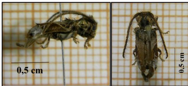
Figura 2. Vista lateral e dorsal de Desmiphora ( D. ) lateralis . (Foto: Autor, 2015).

Segundo Monné (2017), Desmiphora ( D. ) lateralis ocorre em Santa Cruz na Bolívia, no Paraguai e no Uruguai, e está distribuído no Brasil desde o estado do Rio Grande do Sul até Minas Gerais. A ocorrência da espécie é documentada para o estado do Rio de Janeiro (Monné et al., 2009). Desmiphora ( D. )