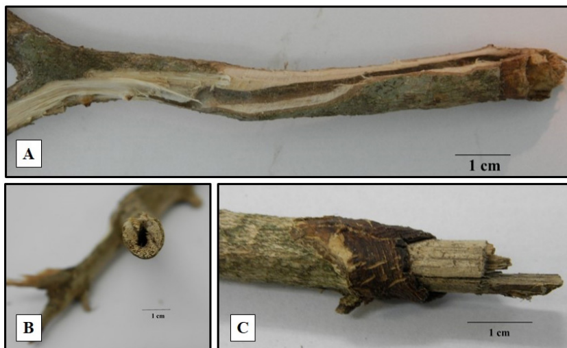
Figura 3. Corte longitudinal (A), corte transversal (B) e detalhe da região do descascamento (C) de galhos de Eugenia uniflora atacados por Desmiphora ( D. ) lateralis ..

De acordo com a classificação dos galhos atacados a partir do diâmetro, verificou-se uma preferência de descascamento